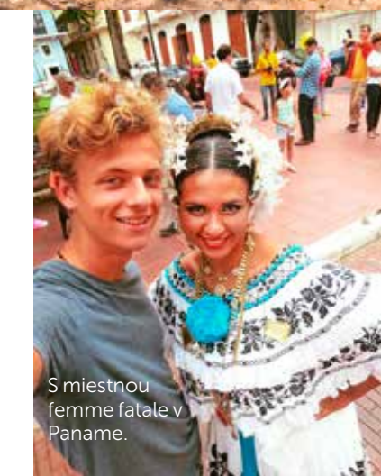
S miestnou femme fatale v Paname.