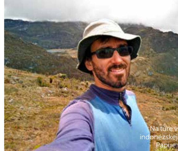
Na túre v indonézskej Papue.