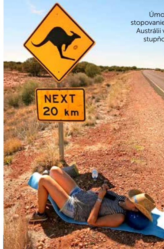
Úmorné stopovanie po Austrálii v 45 stupňoch.