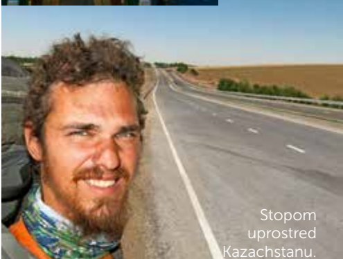
Stopom uprostred Kazachstanu.