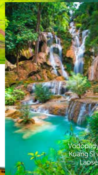
Vodopády Kuang Si v Laose.