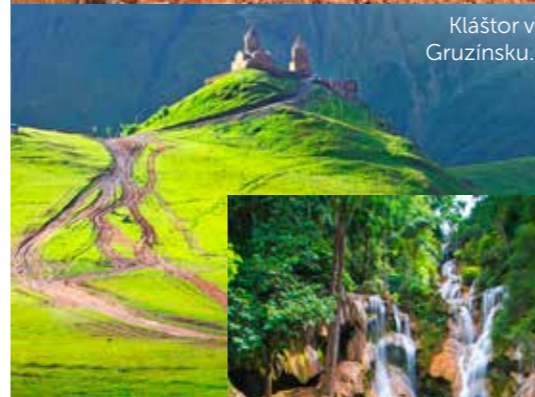
Kláštor v Gruzínsku.