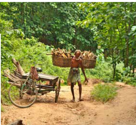
Bojové umenie z Keraly v Indii.