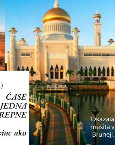
Okázala mešita v Bruneji.