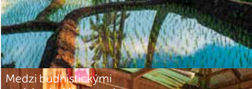
Medzi budhistickými mníchmi v Mjanmarsku.