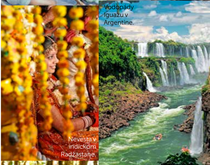
Nevesta v indickom Radžastane.