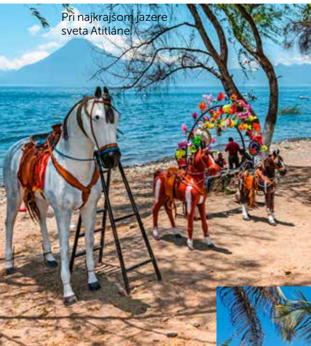
Pri najkrajšom jazere sveta Atitláne.

Pričuchnite s nami k vzrušujúcemu svetu troch slovenských sólo cestovateľov, ktorí zažívajú rozprávkové cesty-necesty za pár eur, pretože vedia, že „najsamlepšie“ veci sú zadarmo.